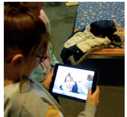
Verschiedene Eindrücke vom Kurzfilm-Schnuppertag in Lavin