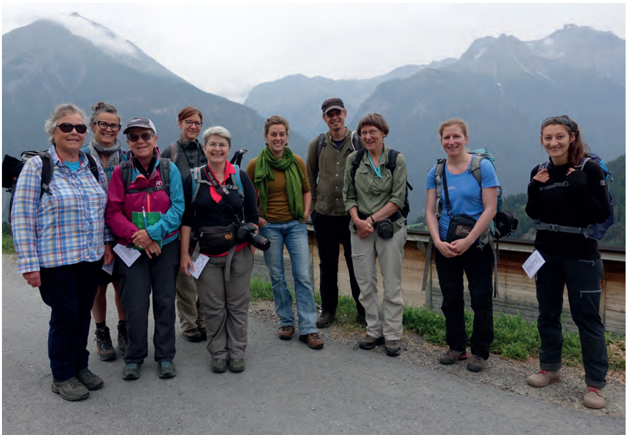
Botanische Fortbildung 2019. Für die Einführung in die Theorie wird das Lokal von Cinevnà genutzt.

Für die Durchführung des Schnuppertages durften wir die Mehrzweckhalle in Lavin und das angrenzende alte Schulhaus nutzen. Vielen Dank an Anna Bonifazi für die immer sehr wohlwollende und konstruktive Unterstützung.